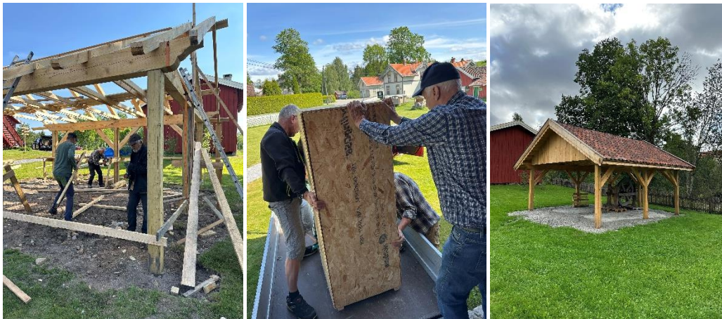
Frå frivillig innsats og arbeide med ny paviljong til museets Fordson traktor 2025.

Andre aktørar som nyttar Bø museum sine lokale fast: Litteraturgruppe ein gong i månaden vår og haust, Spelemannslaget Bøheringen øver annankvar veke vår og haust.