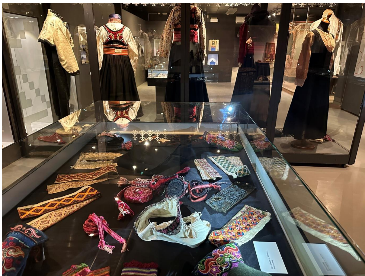
Frå utstillinga 2025, foto: C. Authen.

Bø museum er eit regionalt museum danna september 1977. Museet var tidleg tufta på eit samarbeid mellom Bø kommune, Bø ungdomslag, Bø bondekvinnelag, Bø historielag, Bø mållag, Spelemannslaget Bøheringen og Telemark distriktshøgskule. I byrjinga og fram til og med året 1999 heitte museet Bø bygdemuseum, før det i år 2000 skifta namn til Bø museum. Frå 1981 kunne publikum takast imot ved museet og frå 1982 hadde museet fast opningstid. Bø museum var i perioden 01.01.2003 - 31.12.2015 ein del av Telemark Museum. I den perioden hadde Telemark Museum driftsansvaret for Bø museum. Etter dette har museet i hovudsak vore drifta med utgangspunkt i kommunale ressursar og ulike søknadsmidlar, og har sidan skipinga på 1970 talet hatt glede av stort engasjement frå lokal frivillighet.