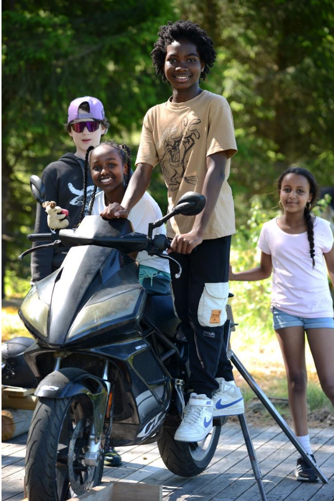
Frå formidlingsopplegg Energi på Kvennøya, mai 2025.

Totalt hadde Bø museum cirka 3000 besøkande i 2025. Årets utstilling hadde ein auke på nær 40% fleire besøkjande samanlikna med 2024. I tillegg kjem dei som brukar museumsområdet og Kvennøya til friluftaktivitetar.