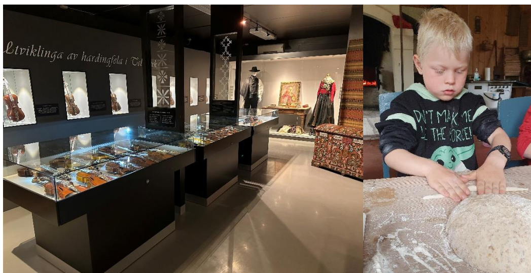
Frå utstillinga 2025 og barn i arbeid med brødbaking.

Det blei registrert vel 1000 besøkande i sommarsesongen. Det var spesielt godt fram møte dei dagane det var program. To sundagar var det sal av suppe. Museumsområdet såg «innbydande» ut i sommar, vedlikehaldsgruppa gjorde ein god jobb med kantslått rundt omkring, og kommunen har slått gras et ca ein gong i veka i løpet av sommaren.