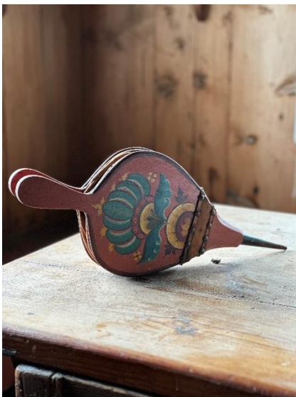
Frå arbeid med dokumentasjon av samlingane på Østerli sommar 2025.

Det er elles utført noko ordningsarbeid med gjenstandssamlinga i kommunehuskjellaren i 2025. Mange av felene i utstillingsbygget er fotografert i samband med digital utstilling om hardingfelesamlinga til museet, men arbeidet er ikkje gjort ferdig da midlar først blei løyvd november 2025.